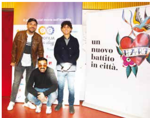
Il “trio” di Casa Surace

Un genitore dell' AEL ha raccontato del figlio e di aver combattuto perché accettasse la sua condizione senza vergognarsene.